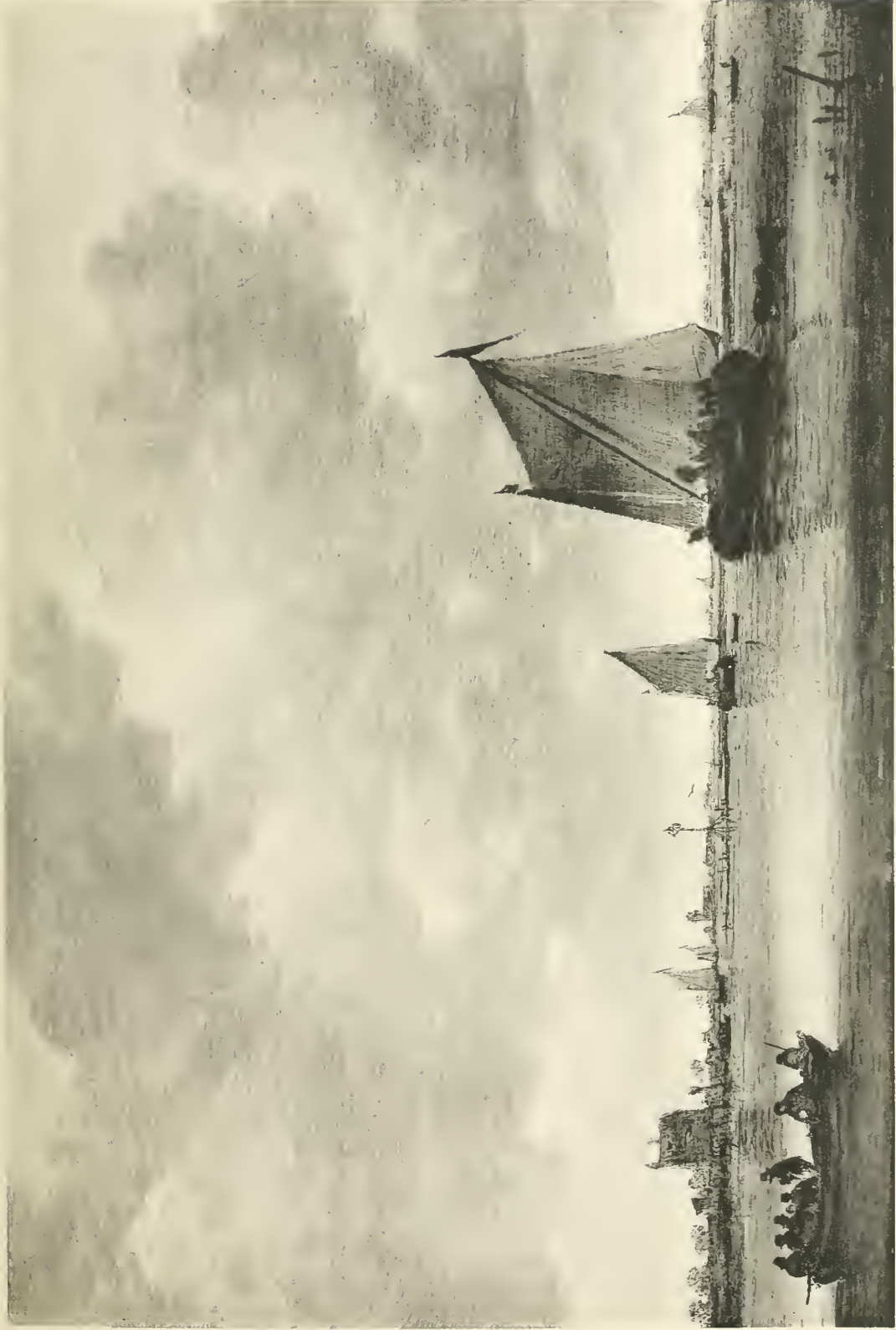
J. VAN GOYEN